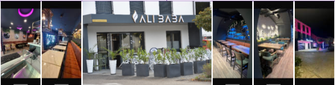
Kremstalstraße 7, 4501 Neuhofen/Krems